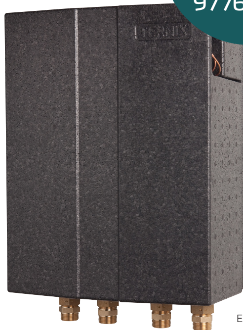
Eksempel på unit.