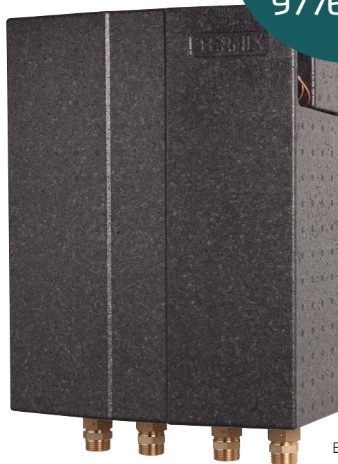
Eksempel på unit.